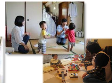
育児支援のイメージ