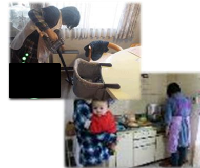
家事支援のイメージ